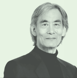
Dirigent Prof. Dr. h.c. Kent Nagano