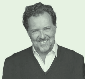
Kammersänger Prof. Dr. Dr. h.c. Christian Gerhaher