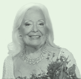
Kammersängerin Dame Gwyneth Jones